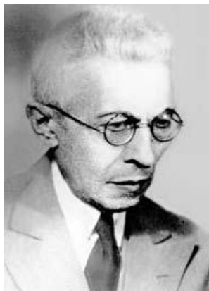
Мамед Садыкбек Агабекзаде Генерал-майор, вице-министр внутренних дел